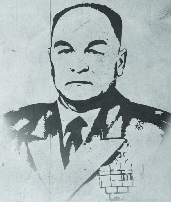
Кандыбин Борис Григорьевич Герой Советского Союза